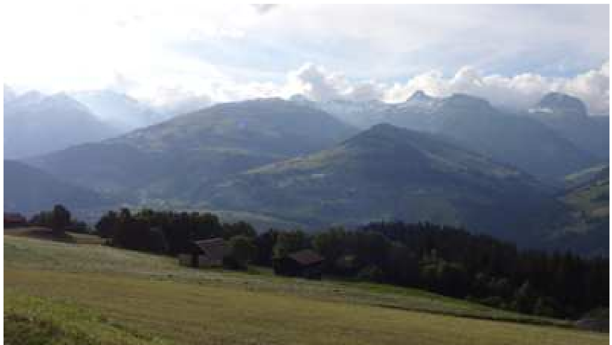
Aussicht auf das "Skigebiet" Brigels-Waltensburg-Andiast