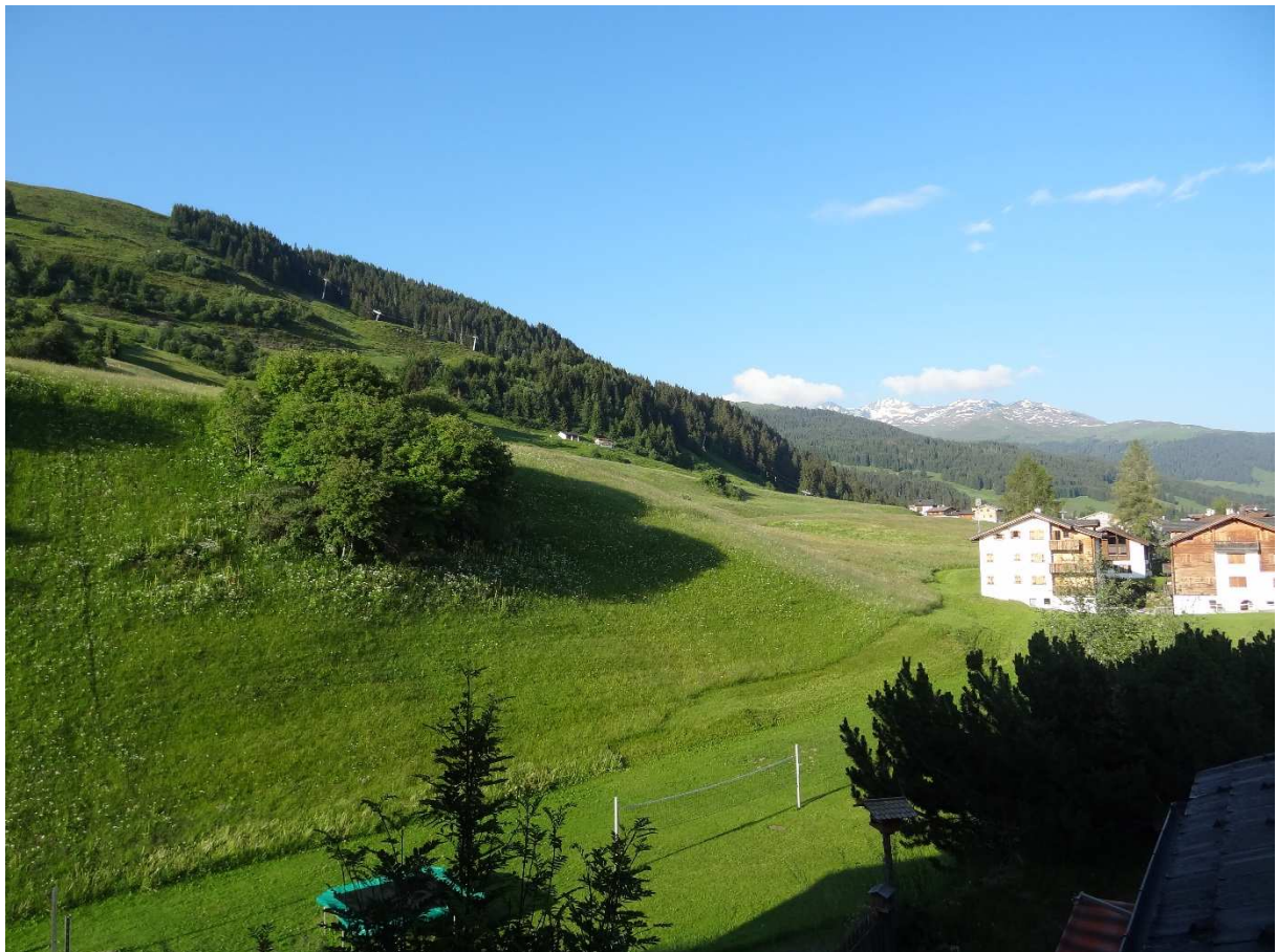
...und schon bald lacht der nächste Morgen ins Schlafzimmer hinein.