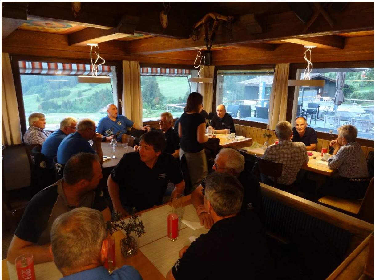
Abendessen auf der Hinreise im Hotel Cresta in Dieni (Rueras GR)