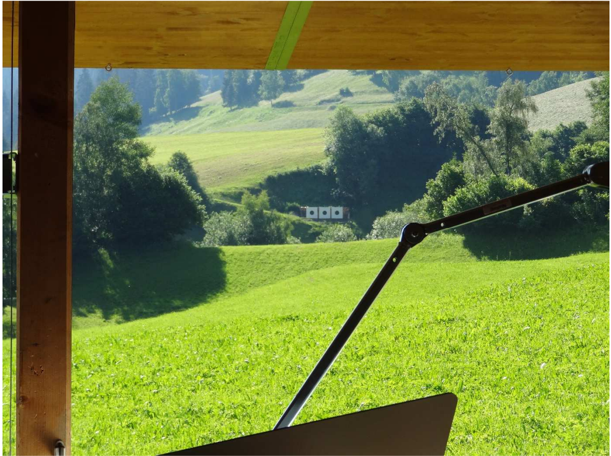
...aber die Sicht auf die 3 Scheiben ist gut.