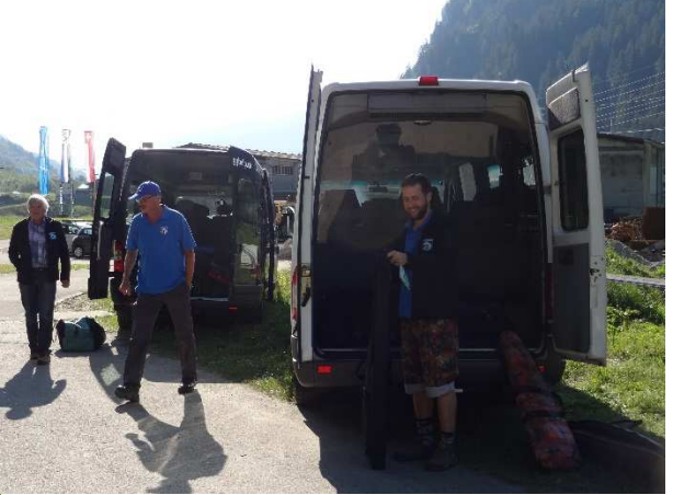
Unsere Mietbusse warten