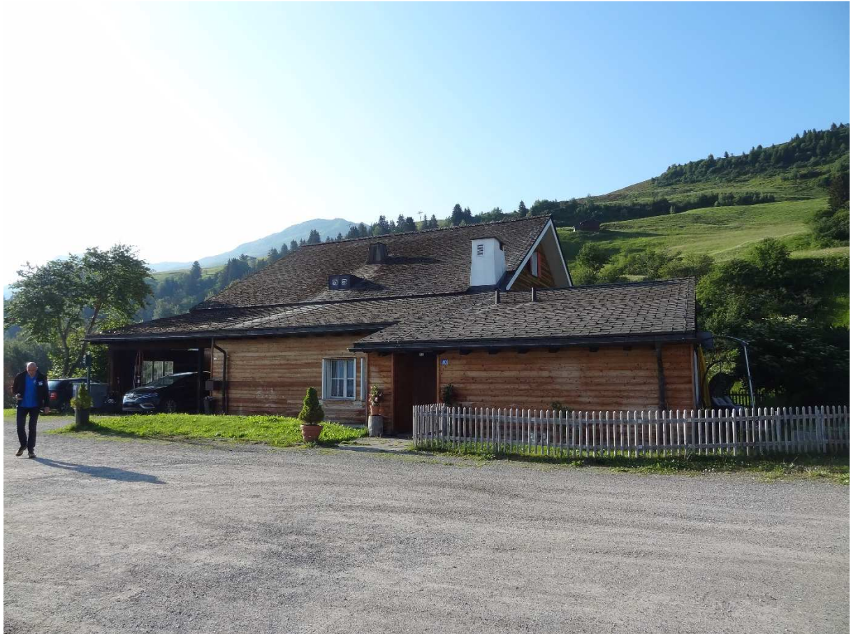
Unsere Unterkunft, das Meilenerhaus in Meierhof (Obersaxen GR)