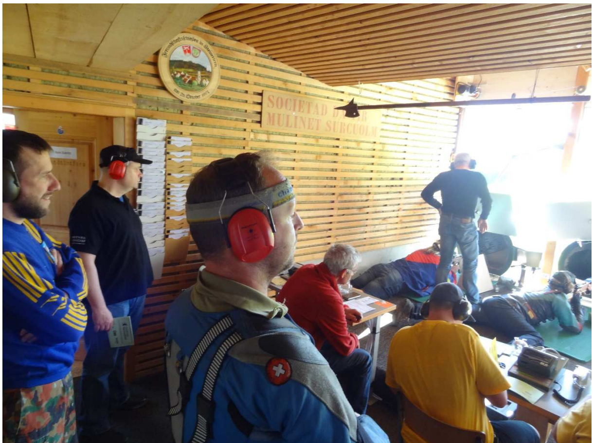
Gespannt wird auf die Resultate geschaut, sowohl im Schiessstand...