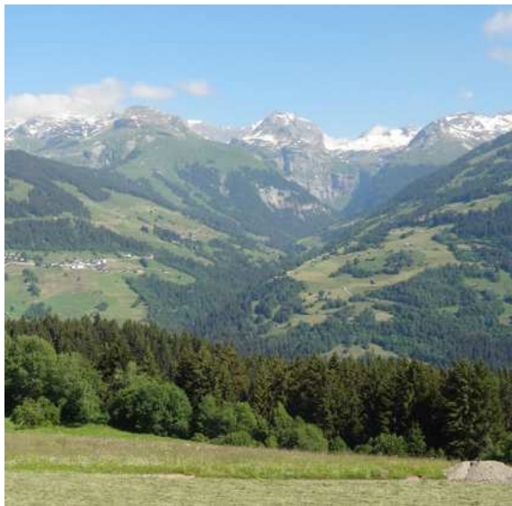
Aussicht Richtung Panixerpass...