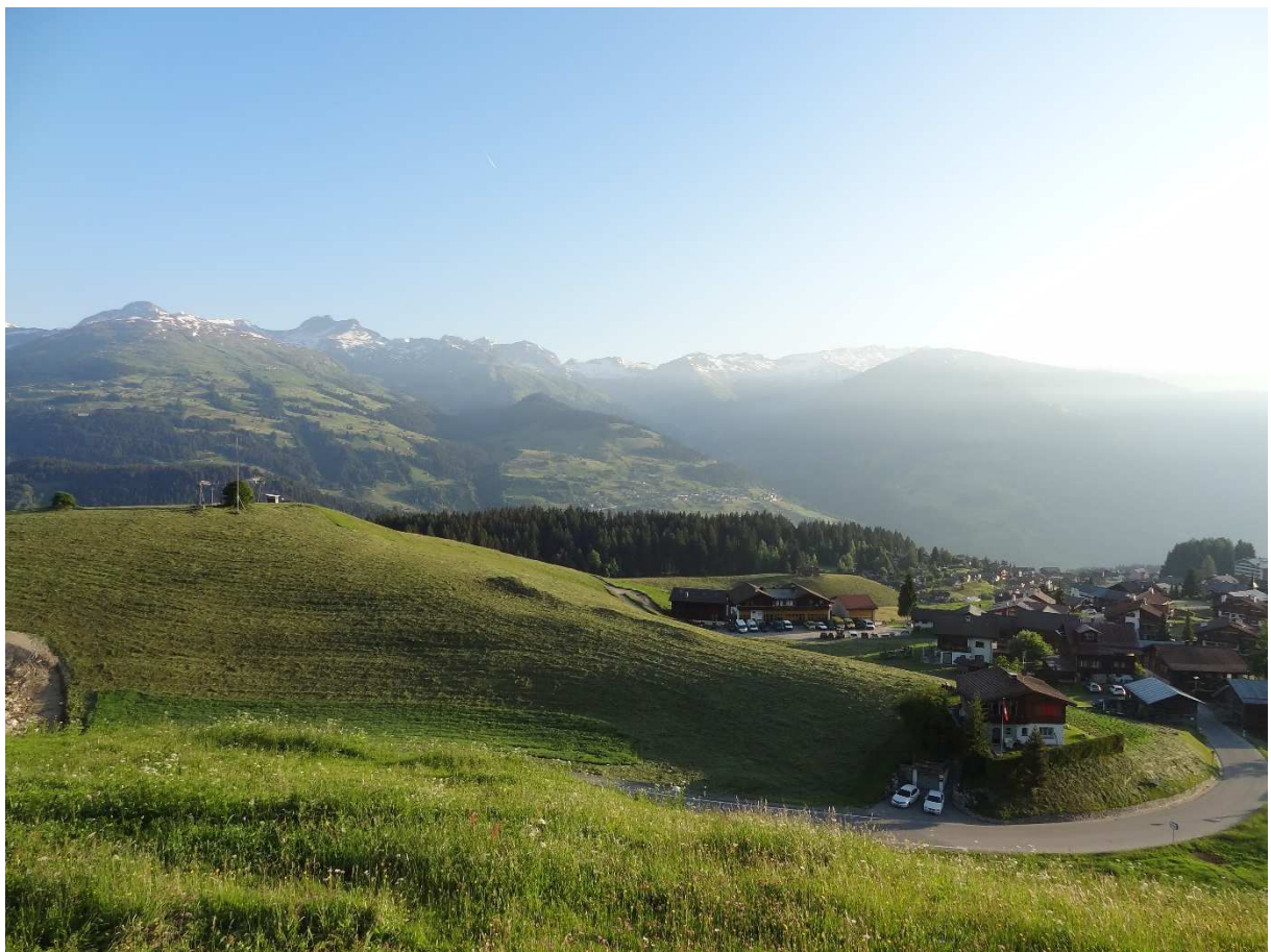
Morgenstimmung vor der Unterkunft Meilenerhaus, Meierhof (Obersaxen GR)