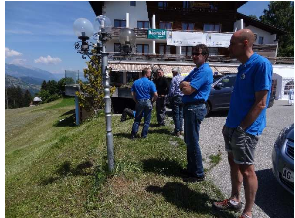
...und die Aussicht genossen, es lohnt sich: