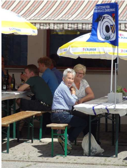
Es wird diskutiert...