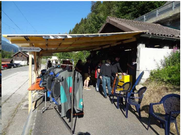
Waffenkontrolle im Festzentrum bei Rueun/Ruis GR