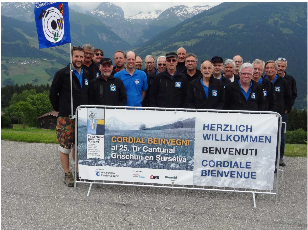
Unser Schützenverein Kehrsatz-Zimmerwald