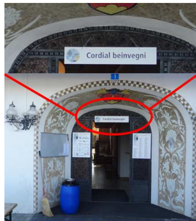
Zwei herzliche Willkommen beim Schiessplatz Hotel Mundaun, Surcuolm GR