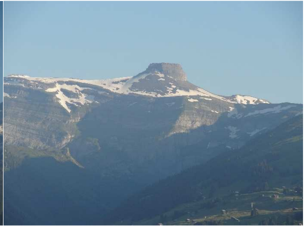
und daneben der Bifertenstock