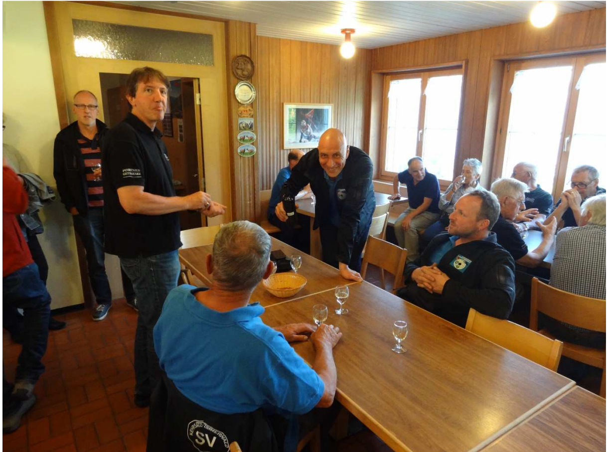
Abends in der Unterkunft Meilenerhaus, Meierhof (Obersaxen GR) wird diskutiert, Apéro genossen, gewitzelt und gelacht bis das feine Znacht serviert wird.