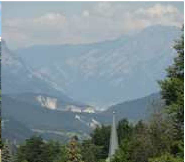
...und Richtung Rheinschlucht und Chur