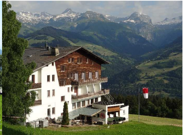
Der Schiessstand im Hotelkeller