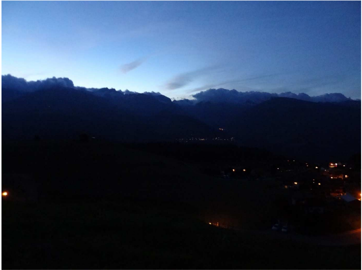
Ankunft in Meierhof (Obersaxen GR) bei Dämmerung