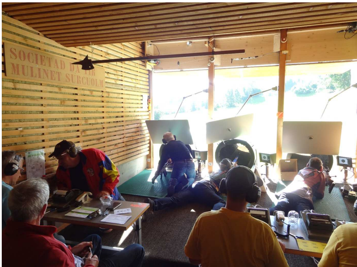
Im Schiessstand ist es eng...